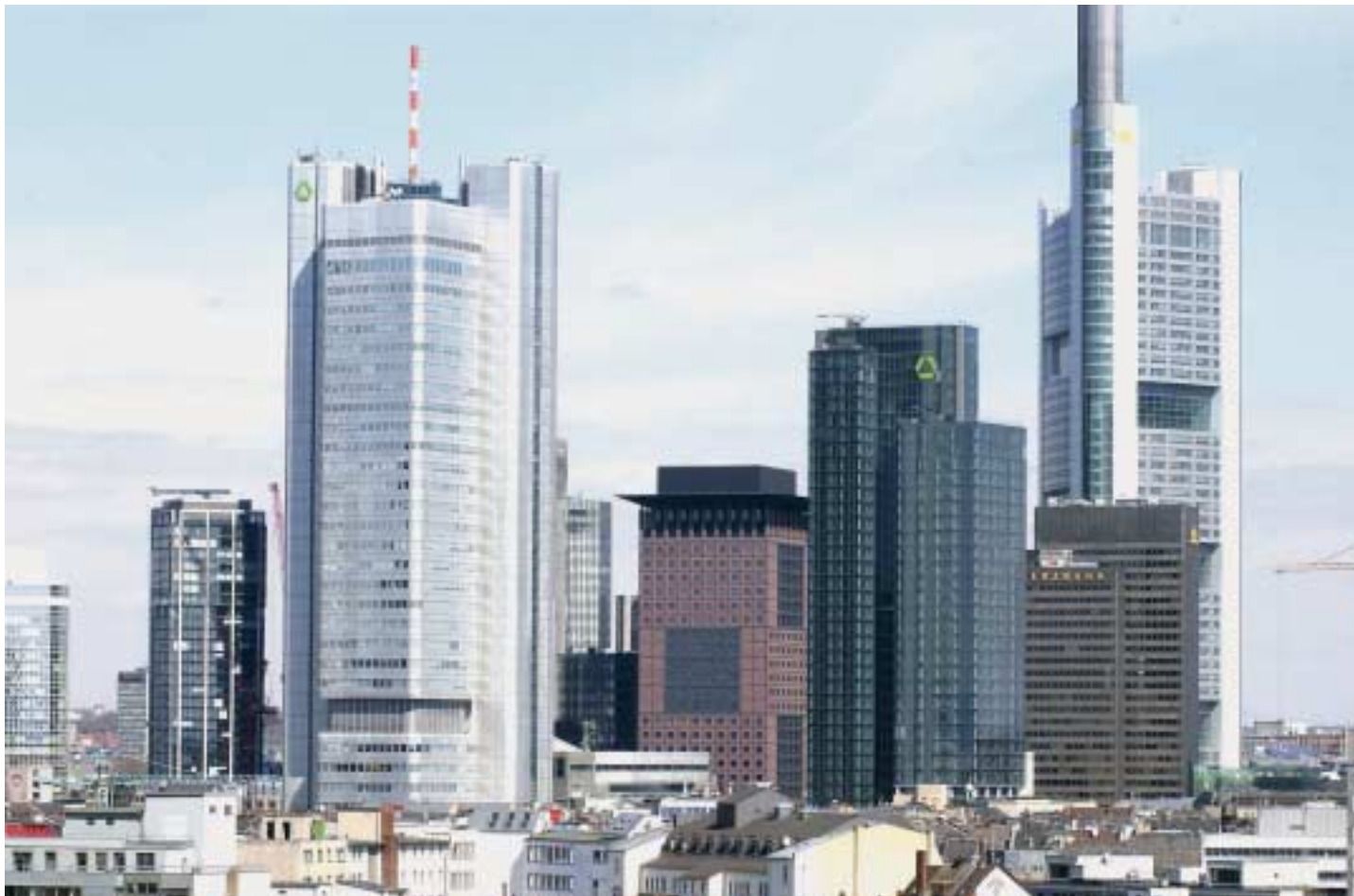
Factoring: Bessere Position in der Bankenwelt durch erhöhtes Eigenkapital.