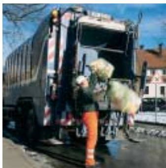
Dienstleistungen: Forderungen sind abzutreten.

und wird auch forderungsgenau abgerechnet. Bei einer Forderungslaufzeit von z.B. 38 Tagen fällt der Zins auf die Bevorschussung von genau 38 Tagen an. Übliche Zinssätze liegen zwischen 4,0 Prozent und 8,0 Prozent und sind meistens an einen Referenzzinssatz (z.B. 3M-EURIBOR) gekoppelt. Tendenziell ist der Zins umso niedriger, je besser die Bonität des Kunden ist.